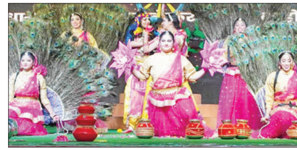
रादौर। कार्यक्रम में सांस्कृतिक प्रस्तुतियां देते विद्यार्थी।