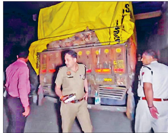
यमुनानगर। शांति कॉलोनी स्थित फैक्ट्री से बरामद खैर की लकड़ी से भरे ट्रक के मामले में कार्रवाई करती सीएम फ्लाइंग की टीम।

छिलका उतारा जाता था और फिर अच्छी क्वालिटी की लकड़ी को बड़े ट्रकों में भरकर दूसरे जिलों व राज्यों