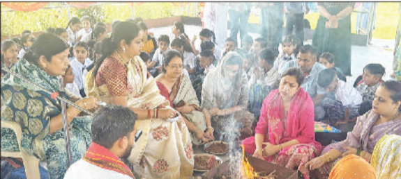
रादौर। हवन यज्ञ में भाग लेते बच्चे व स्टाफ सदस्य।