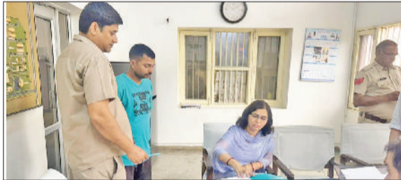
यमुनानगर। लोक अदालत में मामलों का निपटारा करते हुए सीजेएम।