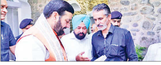
बराड़ा। मुख्यमंत्री नायब सिंह सैनी से मुलाकात करते लापता युवक के परिजन।