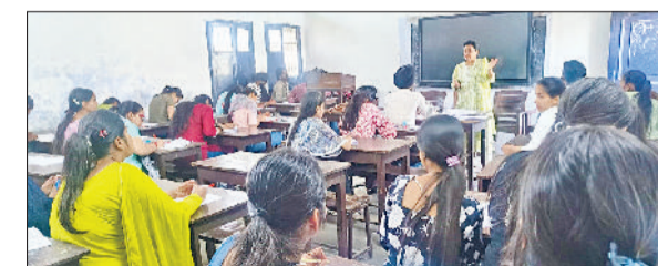
विद्यार्थियों को डिजिटल संसाधनों के प्रभावी उपयोग के प्रति किया गया जागरूक

ई-रिसोर्स तक आसानी से पहुंच सकते हैं जिससे उनकी शैक्षणिक गुणवत्ता एवं शोध क्षमता में वृद्धि होती है। कार्यशाला के दौरान एनडीएलआई प्लेटफॉर्म का लाइव डेमोस्ट्रेशन दिया गया। विद्यार्थियों को रजिस्ट्रेशन की प्रक्रिया भी चरणबद्ध तरीके से समझाई गई। साथ ही, एनडीएलआई क्लब की गतिविधियों एवं इसके माध्यम से मिलने वाले अवसरों पर भी प्रकाश