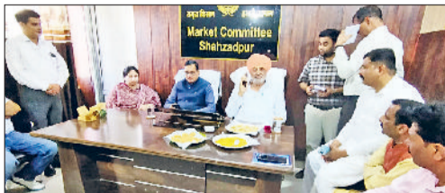
शाहजहादपुर। मंत्री श्याम सिंह राणा अधिकारियों को दिशा-निर्देश देते हुए।

कृषि एवं किसान कल्याण, पशुपालन और डेयरी व मत्स्य पालन मंत्री श्याम सिंह राणा ने अनाज मंडी का दौरा कर सरसों एवं गेहूं खरीद के लिए की गई तैयारियों का विस्तृत जायजा लिया। इस दौरान उन्होंने मंडी में किसानों को मिलने वाली सुविधाओं, फसल सत्यापन, बिजली-पानी, सफाई, पेयजल, बायोमेट्रिक प्रणाली सहित सभी व्यवस्थाओं को जानकारी लेकर अधिकारियों को आवश्यक दिशा-निर्देश दिए। राणा ने कहा कि सरकार का लक्ष्य है कि मंडियों में अपनी फसल लेकर आने वाले किसानों को किसी भी प्रकार की परेशानी का सामना न करना पड़े। उन्होंने अधिकारियों को निर्देश दिए कि मेरी फसल-मेरा ब्यौरा पोर्टल पर फसल