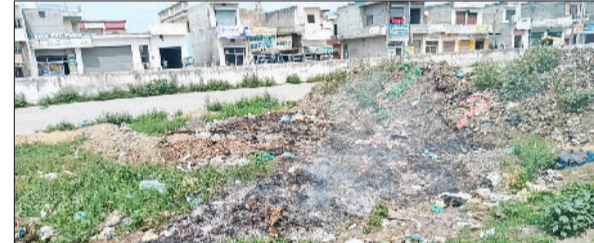
रादौर। अनाजमंडी में कूड़े के ढेर में लगी आग।

कस्बा की अनाजमंडी में गेहूं की सरकारी खरीद का कार्य शुरू हो चुका है। बावजूद इसके अनाज मंडी रादौर में मार्केट कमेटी के साफ सफाई के दावों की पीछे दुकानों के पीछे छुपाए गए कूड़ों के ढेर खोल रहे हैं। मंडी में आदितियों की दुकानों के पीछे लगे कूड़े के ढेर का निपटारा सफाई में आग लगाकर किया जा रहा है। जिससे वातावरण भी दूषित हो रहा है। मंडी के आदितियों ने नाम न